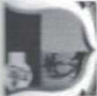
TABELA EXPLICATIVA - LEGISLAÇÃO DA RECEITA