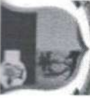
TABELA EXPLICATIVA - LEGISLAÇÃO DA RECEITA