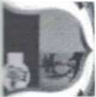
TABELA EXPLICATIVA - LEGISLAÇÃO DA RECEITA