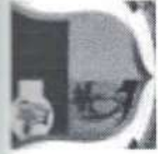
TABELA EXPLICATIVA - LEGISLAÇÃO DA RECEITA